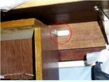
L型金物で家具を柱に固定しています

大きな地震が起きたとき安全に避難出来るようにしておかなければなりません。家具が倒れたり、家具から物が飛び出したりして大変危険です。危険を回避するためにも、家具の固定や扉の開き止めの取り付けも大事な耐震対策となります。