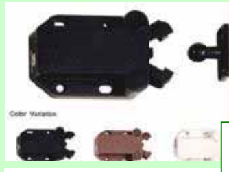
クワガタラッチ 扉を閉めると、自動的にラッチがかり、内側から押されても、勝手に扉が開くことはありません。