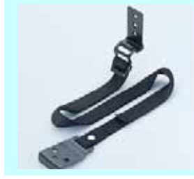
たんすガード たんすを柱などに固定