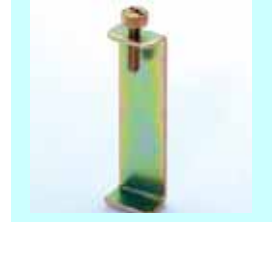
コの字転倒防止金具 上下の家具を固定します