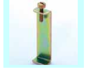
コの字転倒防止金具 上下の家具を固定します