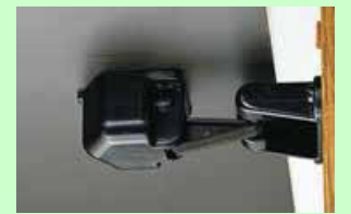
耐震ロック 普段は、普通に扉を開け閉めできますが、地震によって家具が揺さぶられたり、前方に傾くと、瞬時にロック機能が働きます。おおむね震度5以上で動作します。