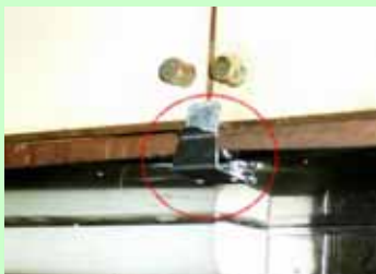
吊り戸棚用 安心ラッチ おもにキッチンなどの吊り戸棚用の、扉開放防止金具です。