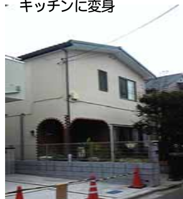
リフォーム後の外観 すっかり変わりました。