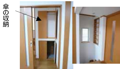
階段下、壁面などのデッドスペースを 生かした収納が沢山