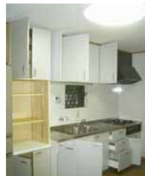
すっきりと使い勝手の良い キッチンに变身