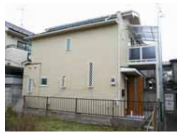
リフォーム後の外観