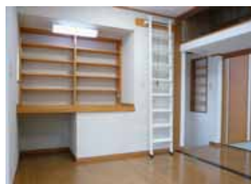
作り付けの机、天板はお施主様が 大事にしていた物を使いました。 狭い部屋を広く使う工夫がいっ ぱいあります。