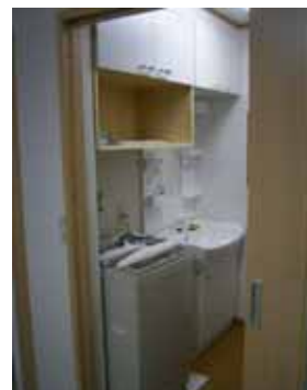
洗面台と洗濯機が片面に 納まり、脱衣場が広く使え るようになりました。