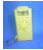
ミニ懐中電灯 終了しました

電球の付いた頭の部分を回転させると光ります。小さいので鞆の中に入れておくと便利でした。