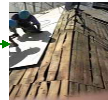
瓦を降ろして、下地を張る