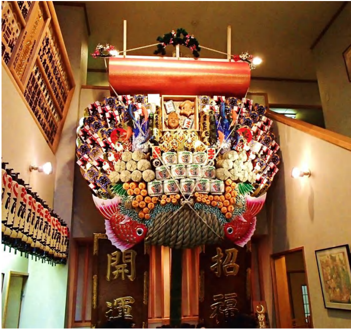
浅草酉の市の大熊手

2017年もあっという間に、残すところ2か月『暑さ寒さも彼岸まで』と言いますが、今年も10月に入っても夏のような暑い日がありました。また涼しいを超えて12月並みの寒さになったり、またまた台風が発生したりで秋らしい気候にならない10月でした。